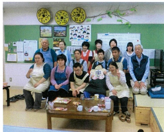
2013. 5. 10 すてっぷはうす