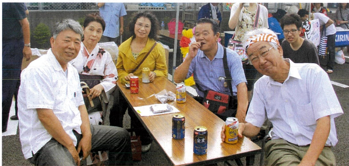
2013. 7. 27 サンシャインフェスタ