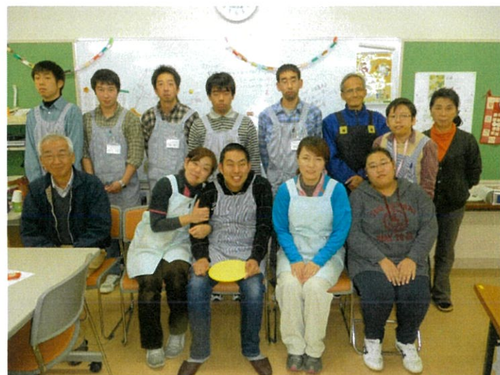
-- 2011. 11. 23 サンライズ